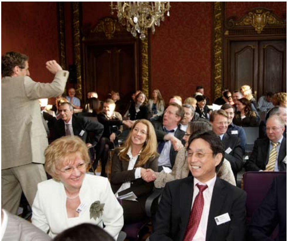
Ein Magnet für Entscheider: Die Netzwerk-Treffen Düsseldorf Personalentscheider sind Höhepunkte für die Branche in der Region.

Zudem engagiert sich Faber&Faber beim Thema Personaldienstleistungen auch in der Pressearbeit. Medien schätzen das Unternehmen als kompetenten Interviewpartner. Zahlreiche Veröffentlichungen in den vergangenen Jahren belegen den gestiegenen Stellenwert in der Öffentlichkeit. Die Bandbreite reicht dabei von der Telefonaktion über die Diskussionsrunde bis zum Einzelartikel.